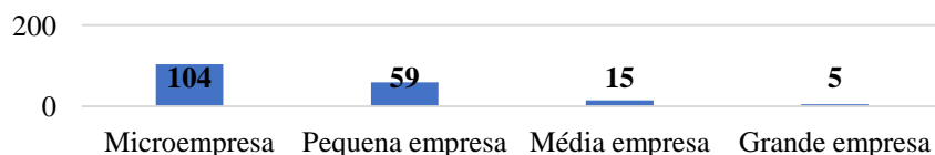
Gráfico 2: Dimensão do tecido empresarial da amostra.

A amostra é composta maioritariamente por microempresas (57%), sendo que as Pequenas e Médias Empresas (PME) representam um total de 97% dos inquiridos (gráfico 2). A dimensão do tecido empresarial da amostra, comparando com os dados da Pordata (2020) para a população alvo, apresenta valores próximos relativos às PME (99,9% população vs. 97% amostra), mas para as microempresas ocorre uma grande diferença (96,1% população vs. 57% amostra). Esta ocorrência é justificável devido à acentuada percentagem de pequenas empresas na nossa amostra (3,3% população vs. 32% amostra).